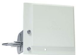
Panneau 2.4 GHZ