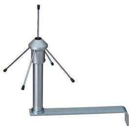
Tripode 868 MHZ